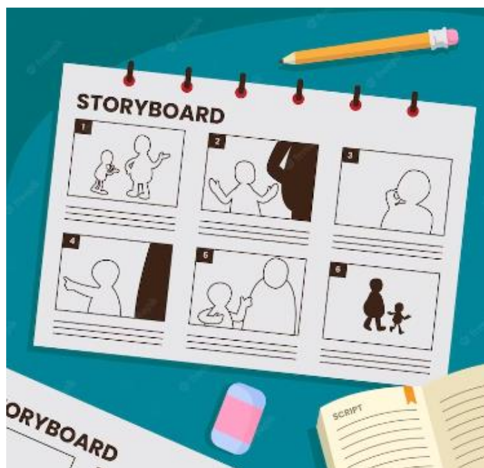
Figura 2 – Exemplo de Storyboard

Você já pode fazer isso ao planejar seu próximo projeto de vídeo, dando forma à história que deseja contar. O storyboard é uma ótima maneira de organizar seus pensamentos e suas anotações em um plano claro antes de começar a produção do vídeo.